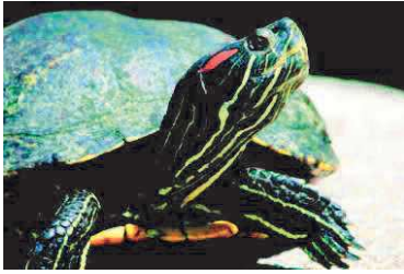
Tortue de Floride

Une espèce invasive (aussi appelée espèce envahissante) est une espèce soit végétale soit animale introduite, dans un nouveau milieu, volontairement ou non par l'humain et qui devient nuisible pour les espèces locales. Elle est originaire d'un pays étranger et menace la biodiversité locale et l'environnement là où elle s'est implantée.