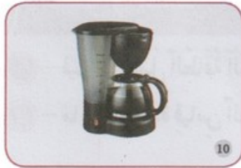
آلَةٌ تُحْضِرُ الْقَهْوَةَ