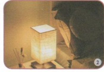
مِصْبَاحُ غُرْفَةِ النَّوْمِ