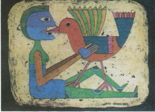
تلقيّن الحرية. لوحة للفنان فيكتور براونر 1954. Victor Brauner.

منذ كتابه «عقم المذهب التاريخي»، نصّب كارل بوبر نفسه منتقداً للتحتمية في مجال العلوم الإنسانية ومناصراً للنزعة الاحتمية. ولكنه لا يذهب إلى حد اعتبار الحرية الإنسانية معطى مطلقاً بل يرى أنها خاضعة للمحددات والقواعد المتوارثة في مجال من المجالات وكذا للسياقات والظروف المحيطة.