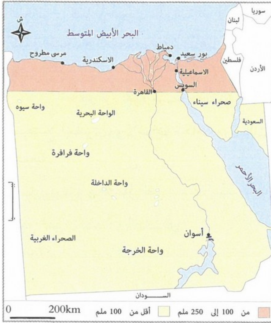
الوثيقة 2 : خريطة (استعمال الأرض بمصر)