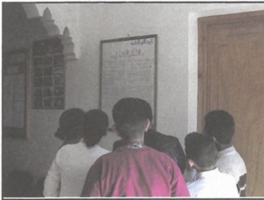
تلاميذ يطلعون على قانون الإعدادية