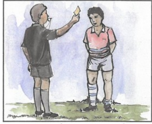
حكم يندر لاعبا ارتكب مخالفة