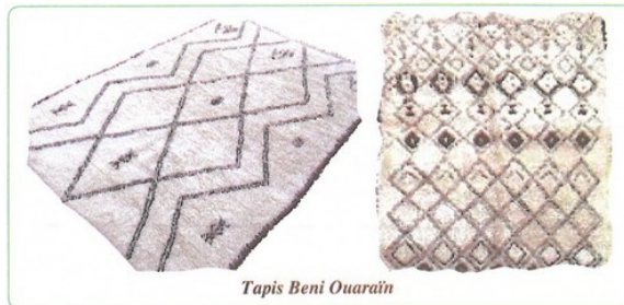
Tapis Beni Ouarain

Il présente de belles dimensions, car à l'origine il était pensé pour protéger du froid les tentes.