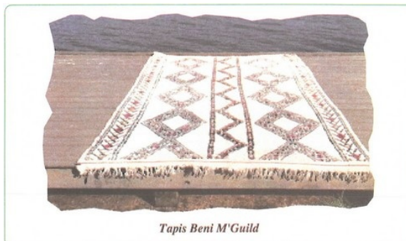
Tapis Beni M'Guild

Sa composition est faite par registres horizontaux successifs meublés de motifs losangiques, de motifs en « x » et de lignes en zigzags.