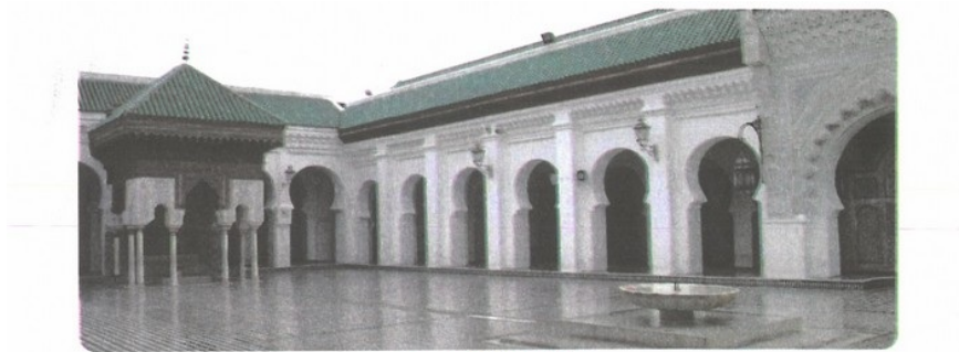
Mosquée Al Qaraouiyine