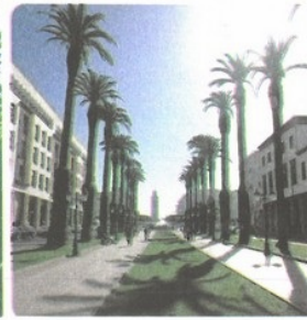
Le centre ville de Rabat