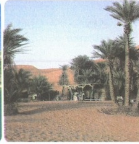
Une oasis marocaine