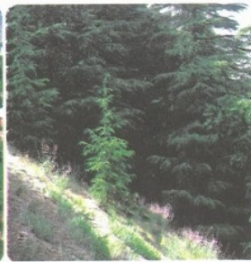
Forêt de Cèdres