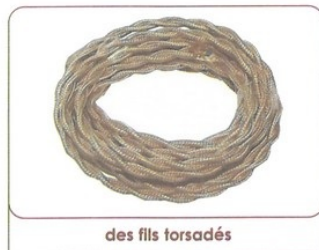
des fils torsadés