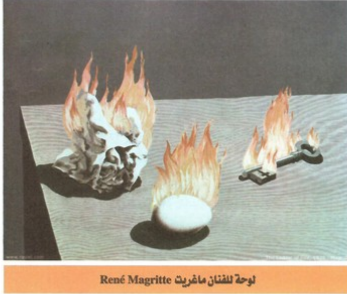
لوحة للفنان ماغريت René Magritte