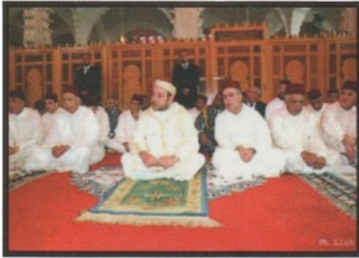
جلالة الملك محمد السادس يؤدي الصلاة