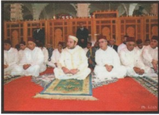
جلالة الملك محمد السادس يؤدي الصلاة