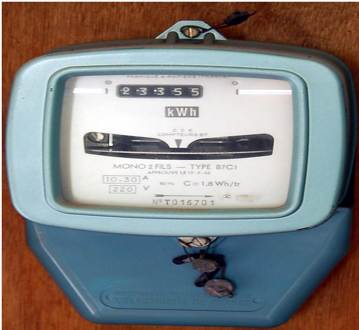
Le compteur électrique