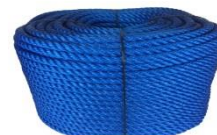
Corde en polyéthylène (PE)