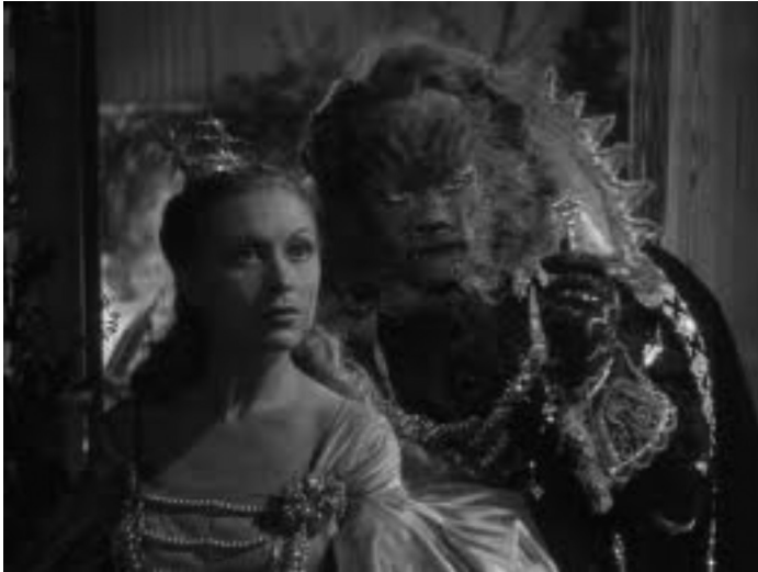
Image du film réalisé en 1945 par Jean Cocteau.

L'une des versions les plus anciennes de ce conte est sans doute celle d'Apulée, qui date du II e siècle.