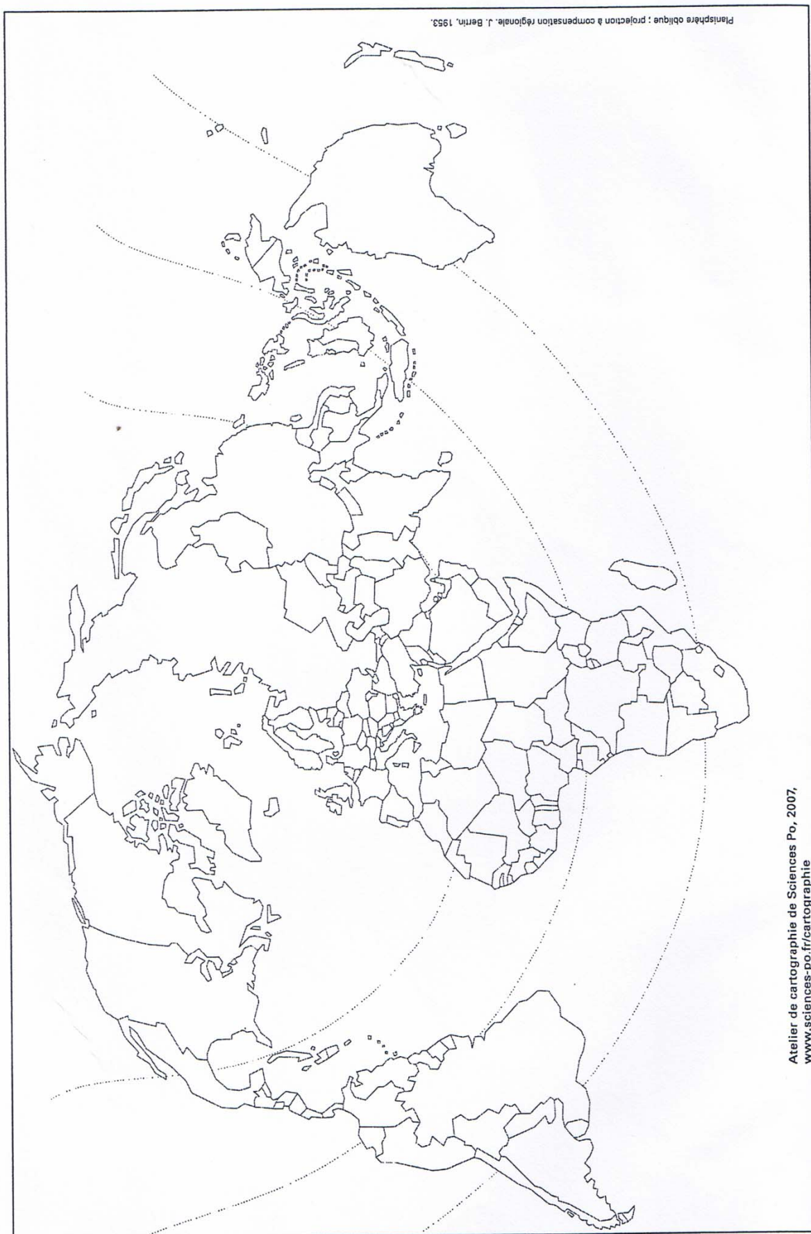
Planisphère oblique : projection à compensation régionale. J. Bertin, 1953.