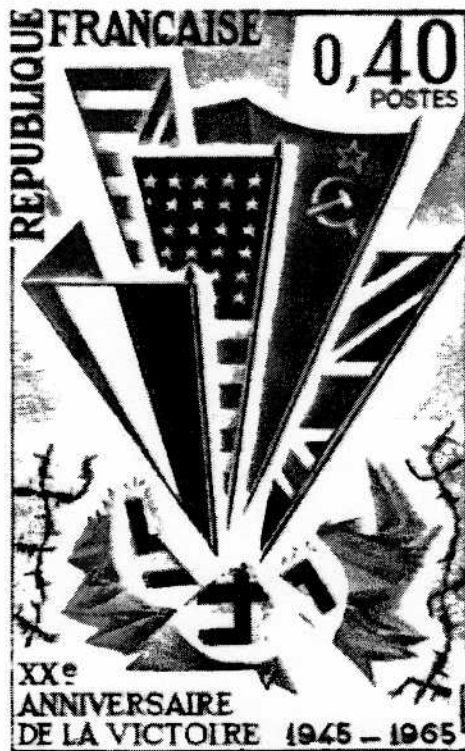
Document 3 : Timbre-poste français émis en 1965