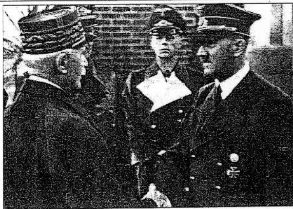
▲ 1. Adolf Hitler et le maréchal Pétain se rencontrent à Montoire-sur-le-Loir, en 1940.

Pendant que certains, comme le maréchal Pétain, collaborent avec l'occupant nazi et se mettent à son service (> doc.1) - et même combattent sous l'uniforme allemand -, d'autres résistent.