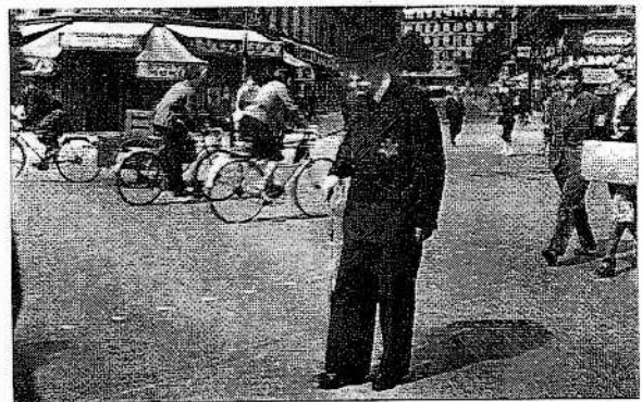
▲ 2. Vieil homme juif dans Paris occupé. À partir de 1942, les Juifs sont obligés de porter une étoile jaune sur leurs vêtements.