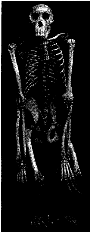
Chimpanzé actuel Volume crânien : 400 cm 3 Angle facial : 45° Face prognathe

Un fossile particulièrement complet a été retrouvé en 1984 aux abords du lac de Turkana, au nord du Kenya. Son étude précise, notamment la dentition, révèle qu'il s'agit des restes d'un adolescent d' Homo erectus qui aurait vécu à cet endroit il y a 1,6 millions d'années.