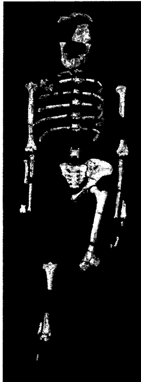
Australopithèque Volume crânien : 450 cm 3 Angle facial : 55°