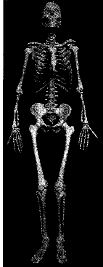
Homo sapiens Volume crânien : 1500 cm 3 Angle facial : 85° Face aplatie

D'après Les origines de l'homme – P. Picq – Tallandier