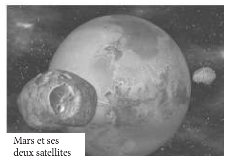
Mars et ses deux satellites

Cet exercice propose la détermination de quelques grandeurs physiques concernant cette planète.