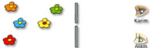
Fig. 1 : Que voit-on ?