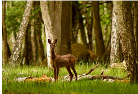
وثيقة 1: أمثلة لأوساط البيئية